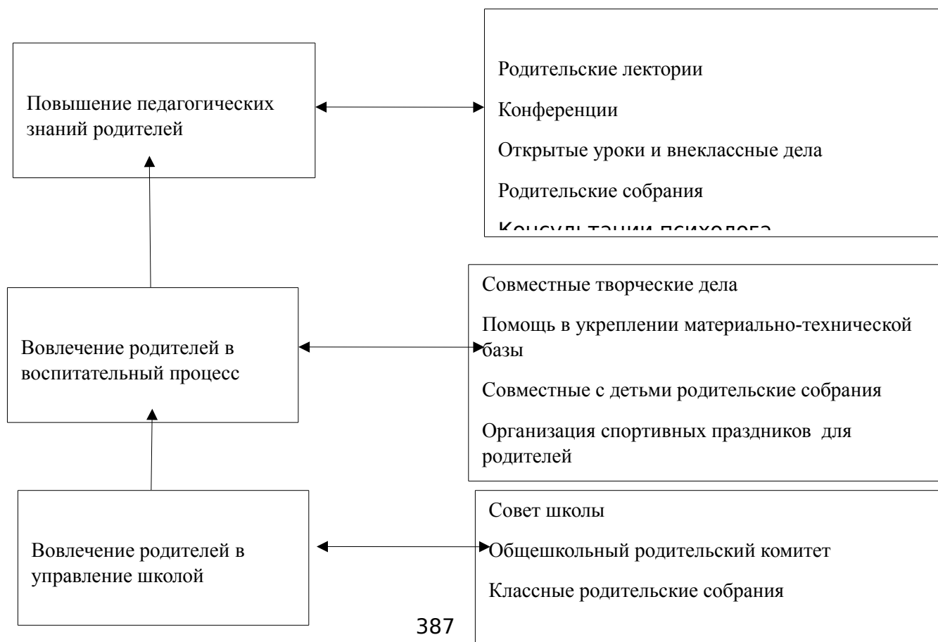
Схема взаимодействия семьи и школы